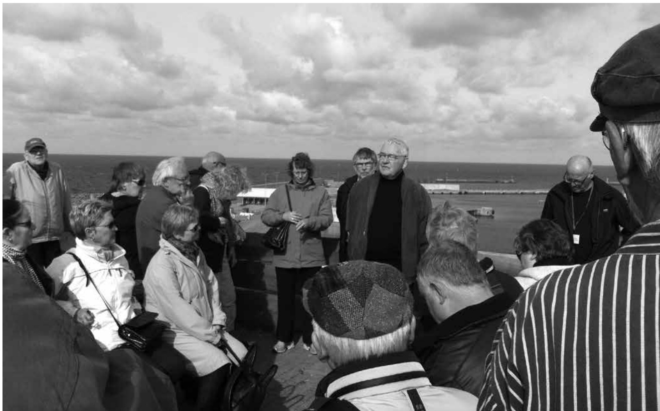
Deltagere i Kulturkonferencen 2013

ungdomsområdet for nylig har fået et Videnscenter, ligesom idrætten blandt andet har et analyseinstitut.