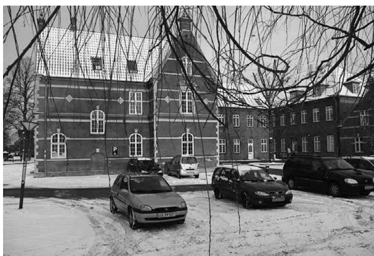
Karens Minde Kulturhus

Så derfor: Overvej om det ikke er på tide, at du melder dig som frivillig. Hvad enten du bliver besøgsven, deltager i et foredrag i Karens Minde Kulturhus, lukker heste på fold én morgen om ugen eller stiller op til en bestyrelse, vil resultatet være, at du bliver glad, og du gør andre glade.